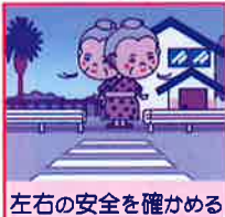
左右の安全を確かめる