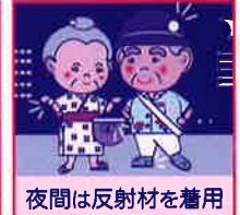
夜間は反射材を着用