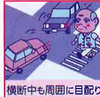
横断中も周囲に目配り