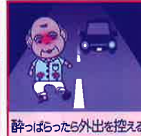
酔っぱらったら外出を控える