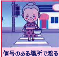
信号のある場所で渡る