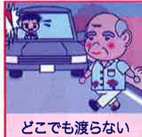
どこでも渡らない